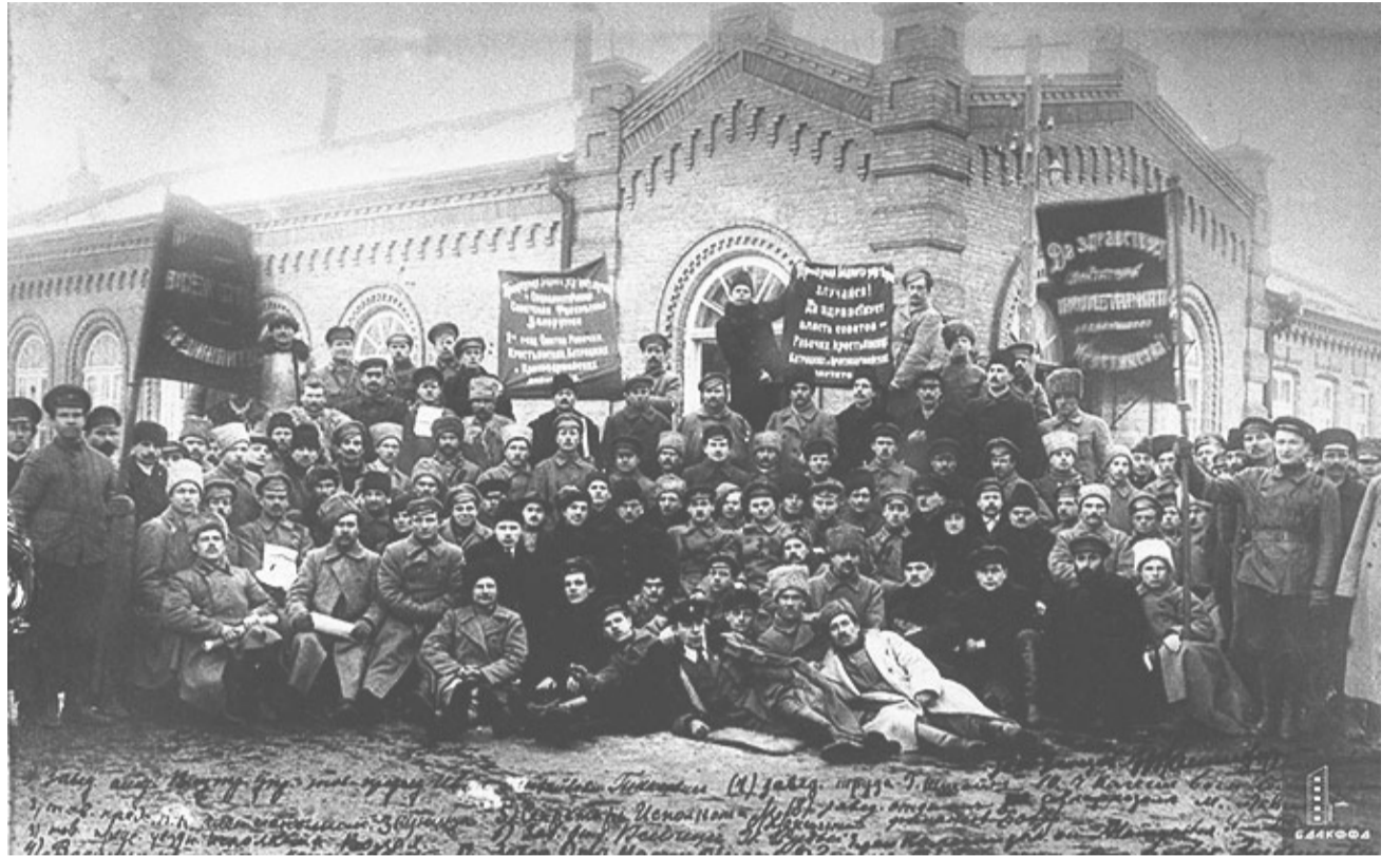
Делегаты I-го Всебелорусского съезда Советов. г. Минск. 2-3 февраля 1919 г.

Первой частью Конституции стала ленинская Декларация прав трудового и эксплуатируемого народа – своеобразная преамбула, в которой отменялась частная собственность на землю. Закреплялась государственная собственность на «все леса, недра и воды, а равно весь живой и мертвый инвентарь, образцовые поместья и сельскохозяйственные предприятия». Они были объявлены национальным достоянием. «В целях уничтожения паразитических слоев общества и организации хозяйства» вводилась всеобщая трудовая