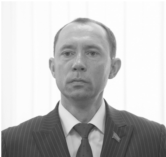
Мнение первого секретаря Центрального Комитета Коммунистической партии Беларуси Сергея Александровича Сыранкова.

В нашей современной политической объективной реальности практика прямого, открытого, честного разговора с людьми стала основополагающей.