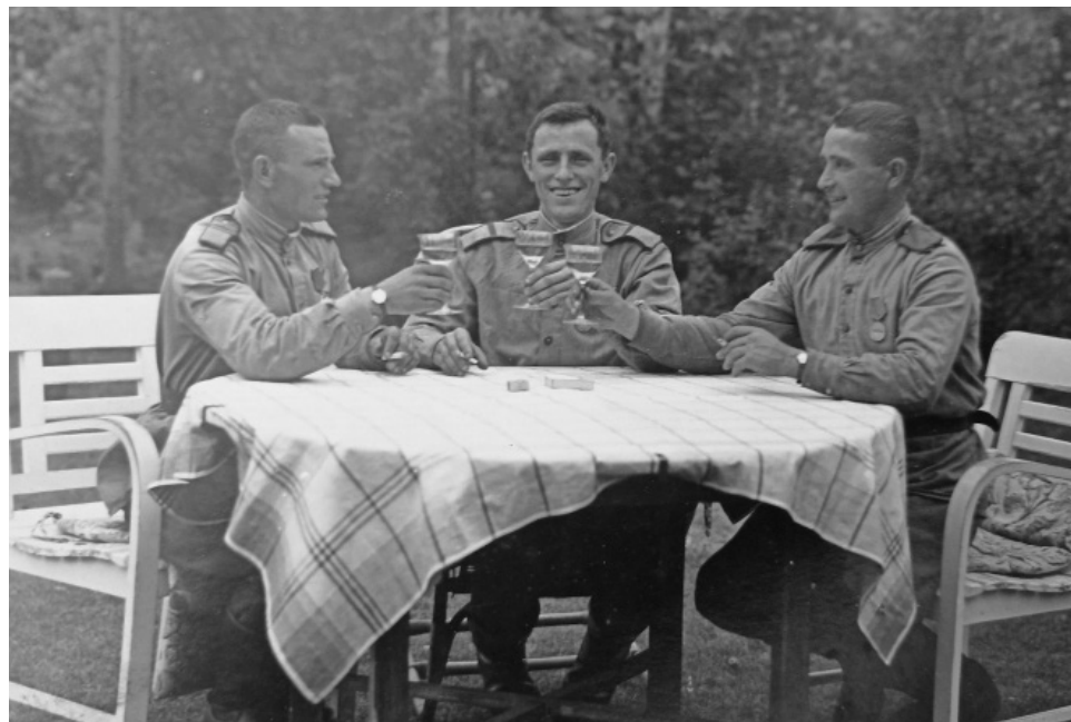
«За Победу!» (июль, 1957 год)

«Коммунист Беларуси. Мы и время» Владимир НИКОЛАЕВ