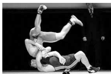
вые Игры современности.

Рассмотрев презентации спортивной борьбы, бейсбола и сквоша, претендовавших на единственное вакантное место в программе Олимпийских игр 2020 года, члены МОК отдали предпочтение борьбе, получившей уже в первом круге 49 голосов. За бейсбол было подано 24 голоса, а за сквош - 22. Борьба представлена на Олимпиадах с 1896 года, когда в Афинах были проведены пер-