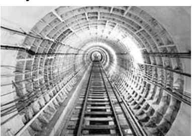
«К 9 мая откроется станция метро «Малиновка». Работы ведутся в очень непростых условиях, — отметил мэр столицы. — Есть недостаток в рабочей силе, не хватает около 200 монолитчиков».