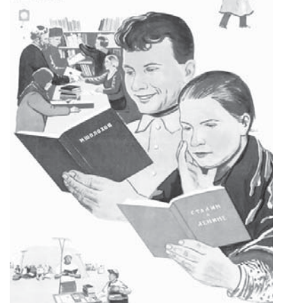
Книга – наш верный помощник в поисках истинного пути и культурно-здорового колоритной жизни.

ХОРОШУЮ БИБЛИОТЕКУ – НАЙДЕМУ СОВЕТСКОМУ СЕЛУ!