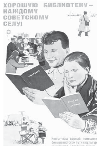
Книга – наш верный помощник в поисках коммунистического пути и культуры замечательной колхозной жизни.