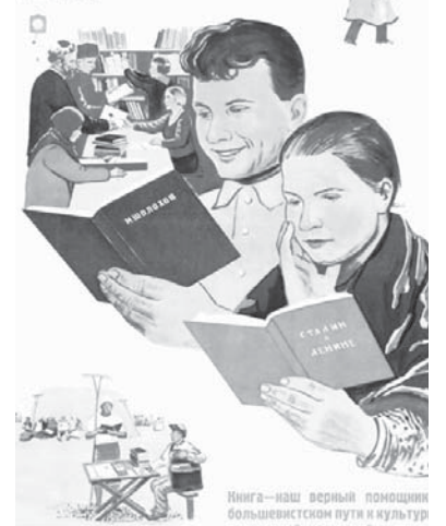
Книга – наш верный помощник в поисках истинного пути и культурно-здорового колоритной жизни.

ХОРОШУЮ БИБЛИОТЕКУ – НАЙДЕМУ СОВЕТСКОМУ СЕЛУ!