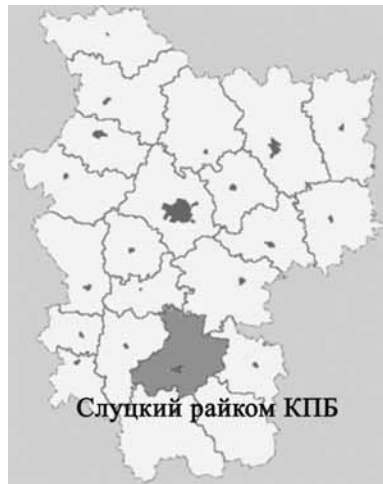
Слуцкий райком КПБ

В сентябре этого года состоялось очередное заседание Слуцкого райкома КПБ, на котором коммунисты Слуцчины обсудили вопрос активизации работы со средствами массовой информации и о повышении роли партийных организаций в работе с пионерскими дружинами школ.