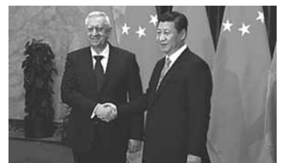
шим. По материалам БЕЛТА