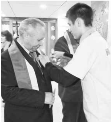
Приглашенных встречали современные комсомольцы - активисты ОО БРСМ. Каждого

Торжественный вечер, посвященный 95-летию образования БССР и созданию КПБ состоялся в Борисове во дворце культуры им. М.Горького.