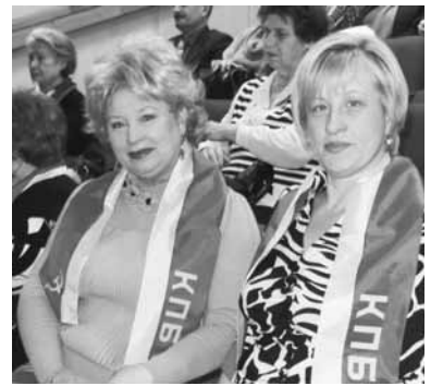
кампанию, ждали неотложные дела по подготовке очередного мероприятия, посвященного 95-летию образования БССР - «круглого стола» с участием представителей всех патриотических общественных объединений.

PS.: На следующий день коммунистов Борисовской партийной организации, активно включившихся в избирательную