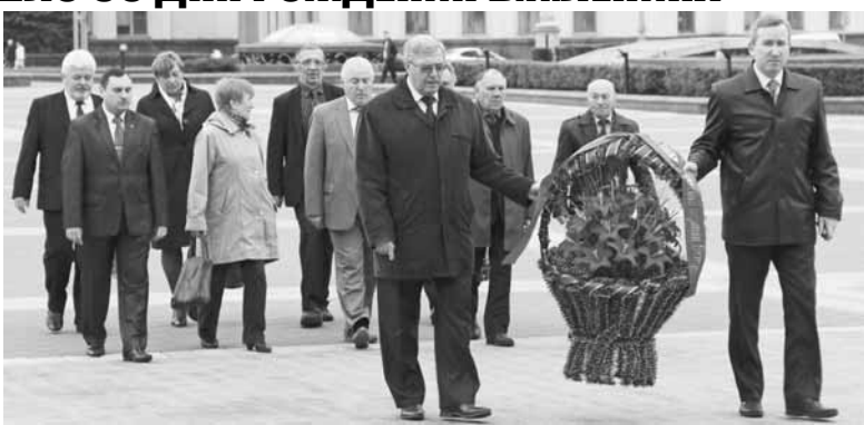
сти и сегодня. Под руководством возглавляемой им партии

Выдающийся философ и экономист, юрист, человек с великим даром предвидения, творческое наследие которого не потеряло своей актуаль-