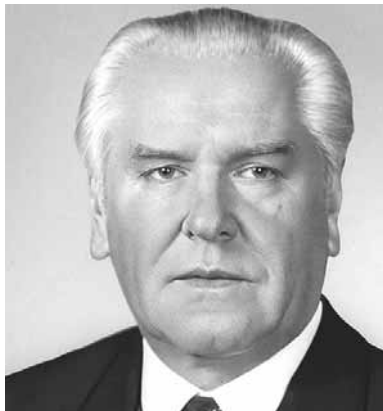
СССР. Природа наделила Вас многи-

мики, умение работать с кадрами, понимание их решающей роли в экономическом и социальном развитии общества позволили внести Вам значительный вклад в повышение эффективности общественного производства, содействовали подъему народного хозяйства. Ваши заслуги перед Отечеством были по достоинству отмечены государством: дважды удостоены высшей награды Родины - ордена Ленина, присвоено звание Героя социалистического труда, награждены Государственной премией