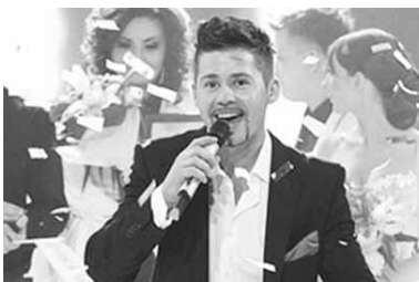
тиции и т.д.

Специалисты работают над подготовкой хореографии сценического номера, занимаются разработкой его графического и светового оформления, а также раскадровкой для режиссерско-постановочной группы Европейского вещательного союза для конкурса в Дании. Вокальные занятия включают отработку всех вокальных партий, постановку дыхания, работу над произношением, технические репе-