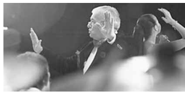
сетят 10 городов Минщины.