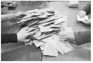
вым действующим президентом Жаком Шираком.

Нынешний кризис подтверждает предположение, выдвинутое Международным Комитетом Четвертого Интернационала (МКЧИ) во время президентских выборов в 2002 г. После того, как тогдашний лидер НФ Жан-Мари Ле Пен победил премьер-министра СП Лионеля Жоспена в первом туре выборов, массовые акции протеста вспыхнули против перспективы выборов между Ле Пенем и пра-