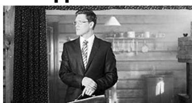
тающийся город настигает его и здесь...

прослеживается дальнейшая судьба полюбившихся зрителям братьев Ходосов. Но главными героями в этот раз выступают представители молодого поколения семьи. Пожив в городе, Андрей Ходос возвращается к земле и селится на хуторе. Однако стремительно разрас-