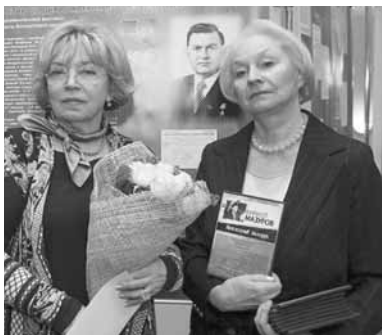
сказал М. Мясникович.

— Кирилл Трофимович обладал незаурядными организаторскими способностями и талантом руководителя. Он многое сделал для развития нашей страны и Минска. Коллеги Мазурова всегда отзывались о нем с теплотой и отмечали его умение вдохновить людей на решение чрезвычайно сложных задач, —