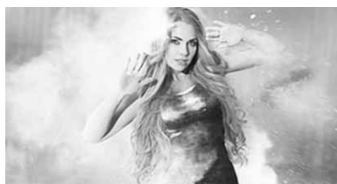
под номером 10.

Представитель Беларуси певец Тео (Юрий Ващук) с композицией «Cheesecake» выступит во втором полуфинале 8 мая