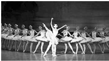
мира - Вены, Варшавы, Санкт-Петербурга, Гамбурга и др.

Завершится фестиваль «Балетное лето в Большом» гала-концертом звезд мирового балета, который соберет белорусских танцовщиков со всего