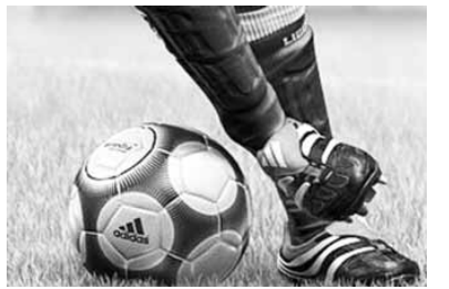
ковые матчи за право выступить на Евро-2020 состоятся в марте 2020 года.

Первая финальная стадия нового турнира с участием четырех сборных, выигравших свои подгруппы, пройдет в 2019 году. Сты-