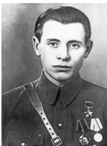
Петр Миронович Машеров. 1944 г.