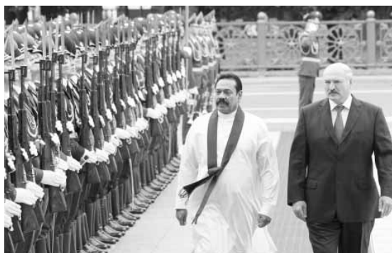
различных государств», - сказал Александр Лукашенко. По материалам БЕЛТА

Глава белорусского государства отметил большие успехи, которых добился Президент Шри-Ланки для процветания и стабилизации ситуации в государстве. «После долгих лет конфликтов на территории Шри-Ланки вы дали своему народу не просто надежду, а гарантию мира и спокойной жизни. И этим самым вы обратили на себя, на вашу страну, взоры лидеров